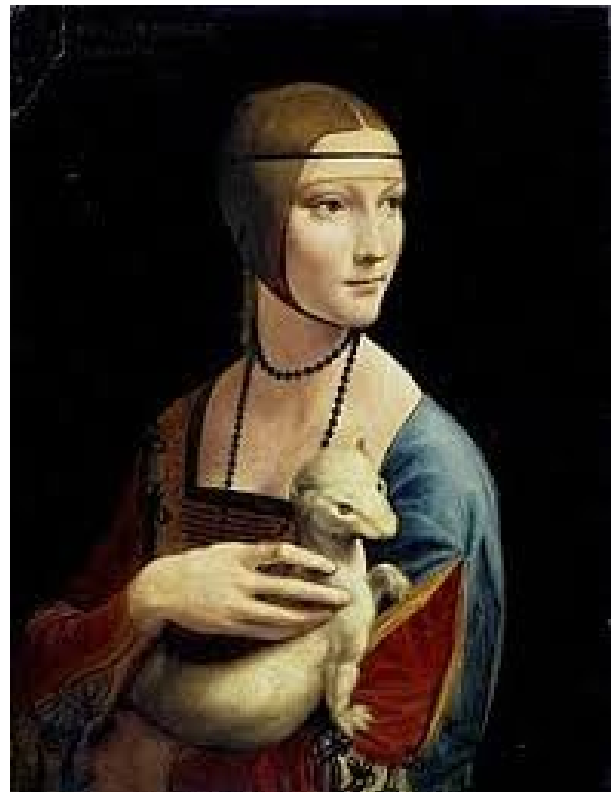
Леонардо да Вінчі, «Дама з горностаєм», 1490, Національний музей, Краків

Леонардо, по всій видимості, не залишив жодного автопортрету, який би міг йому бути однозначно приписаний. Вчені засумнівалися в тому, що знаменитий автопортрет Леонардо (традиційно датується 1512-1515 роками), що зображує