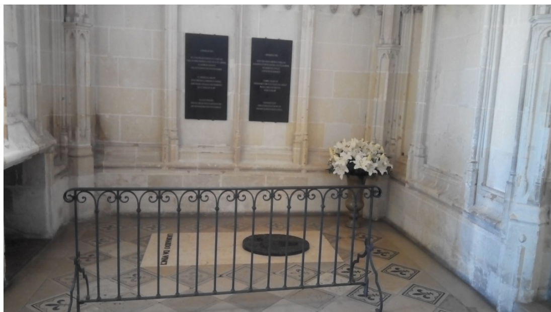
Могила Леонардо да Вінчі в замку Амбуаз (Франція)

«Не обертається той, хто спрямований до зірки», – писав Леонардо.