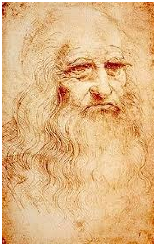
Ймовірний автопортрет Леонардо да Вінчі